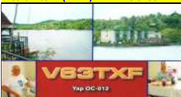
Yap (ESA Bay) OC012