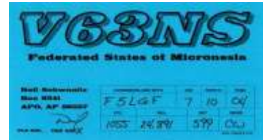
Federated States of Micronesia