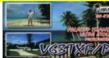
Fakalop Isl (Ulithi Atoll) OC078