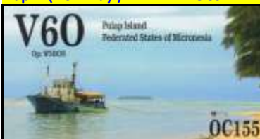
Pulap Isl. OC155