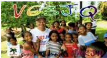
Chuuk Isl. OC011