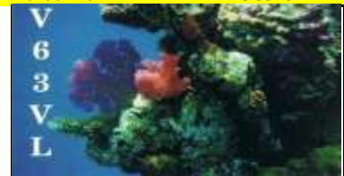
Weno Isl. (Chuuk State) OC011