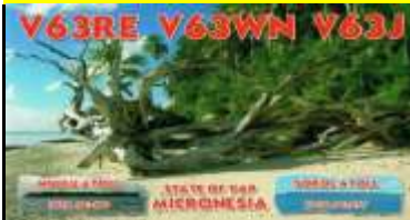
Nuculu Atoll (YAP) OC180