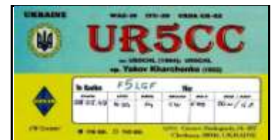
C - Tcherkassy