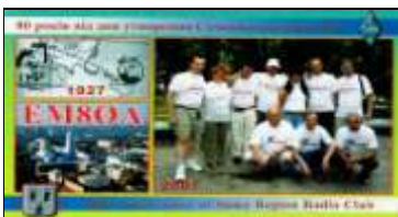
A - Soumy

L'oblast est identifié par la première lettre du suffixe de l'indicatif