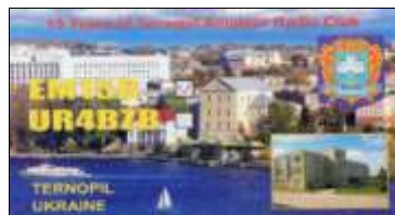
B - Ternopil