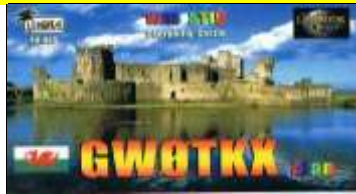
* 5 - Caerphilly