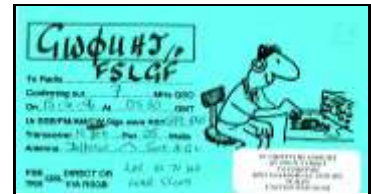
* 3 - Vale of Glamorgan