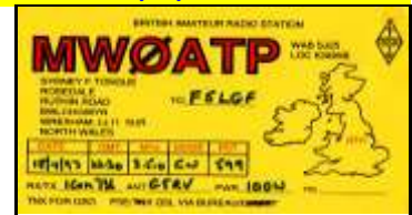
* 9 - Wrexham