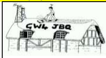
* 8 - Torfaen