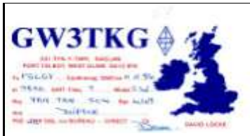
* 1 - Neath Port Talbot