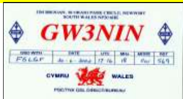
* 11 - Newport