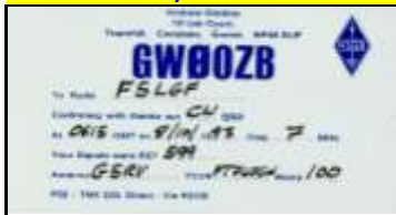
* 7 - Blaenau Gwent