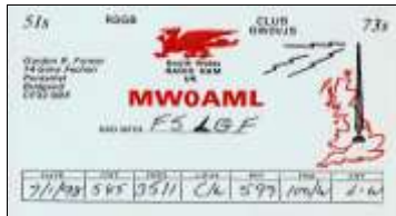
* 2 - Bridgend