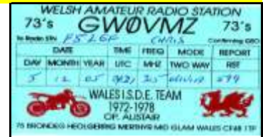
* 6 - Merthyr Tydfil