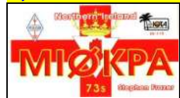
Irlande du Nord