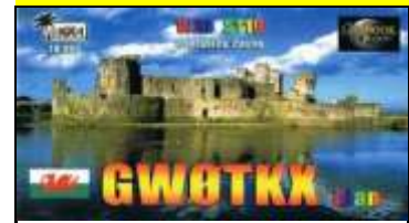
Pays de Galles