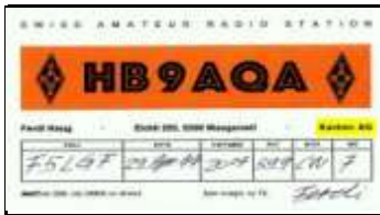
AG - Canton d'Argovie