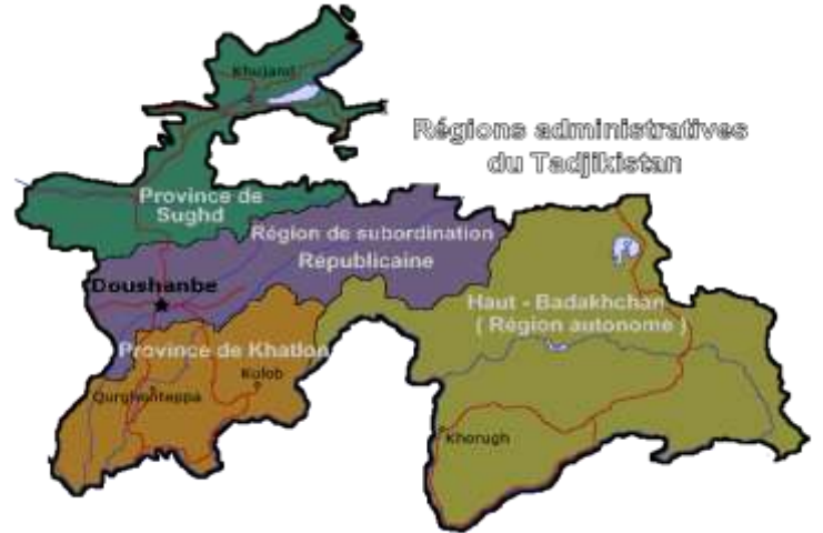
Zones d'indicatifs Radioamateur