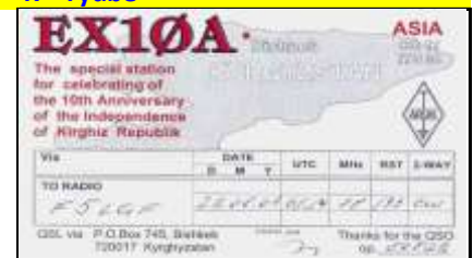
10ème Ann de l'Indépendance

D'autres pages de cet Atlas dédié aux Radioamateurs sont visibles sur http://lesnouvellesdx.fr/atlas.php