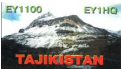
EY1 ( HQ Tadjik Amat. Radio League )