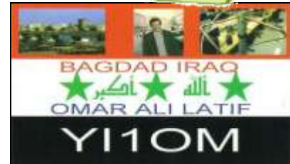
1 - Bagdad