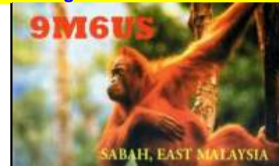
Sabah ( île de Bornéo )