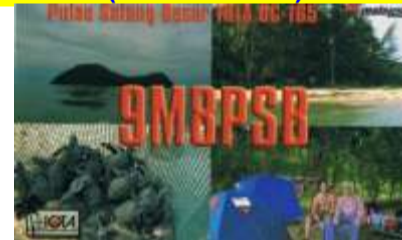
Pulau Satang Besar Island