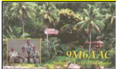
Sabah ( île de Bornéo )