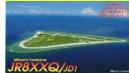
Minami Torishima Isl.