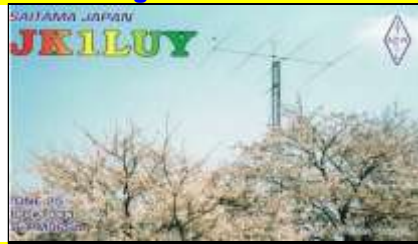
13 - Saitama