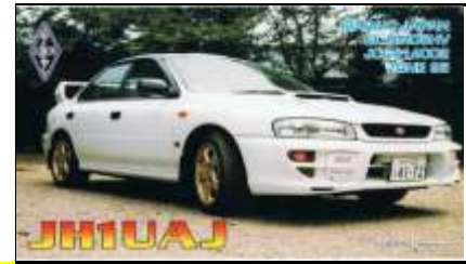
14 - Ibaraki