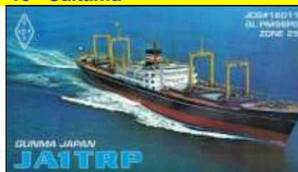
16 - Gumma