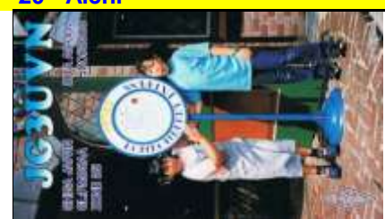
23 - Shiga