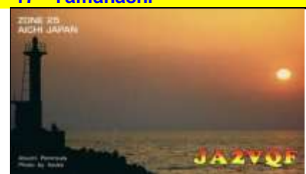
20 - Aichi