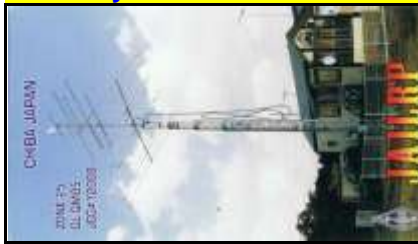
12 - Chiba