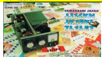
17 - Yamanashi