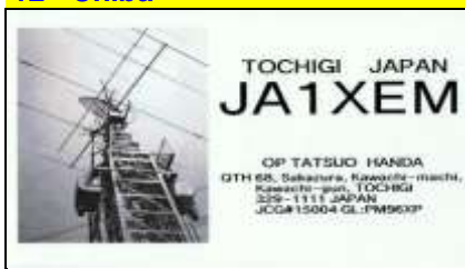
15 - Tochigi