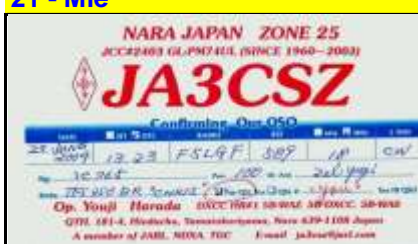
24 - Nara