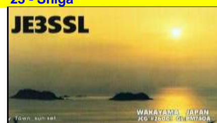
26 - Wakayama