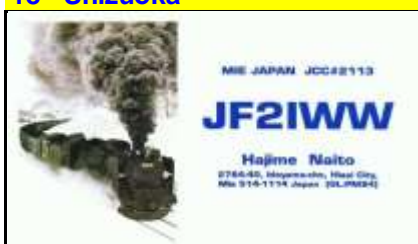
21 - Mie