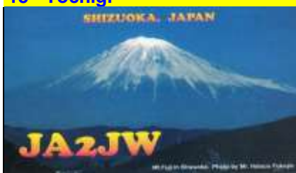
18 - Shizuoka