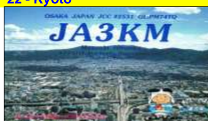
25 - Osaka