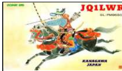
11 - Kanagawa