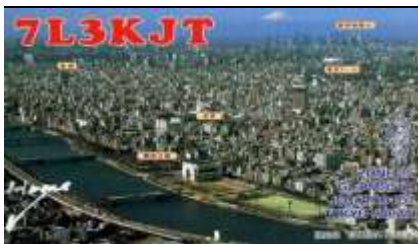
10 - Tokyo