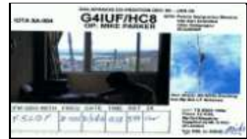
San Cristobal Isl.