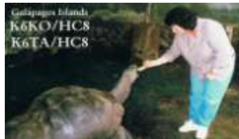
San Cristobal Isl.