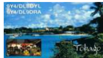
10 - Scarborough