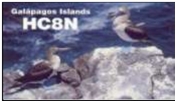
San Cristobal Isl.