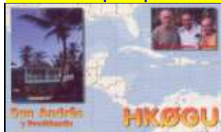
San Andrés Isl.

* -San Andrés et Providencia est un Archipel Colombien dans la mer des Caraïbes formant un Département du pays. * - Malpelo est une île sauvage située à 380 kms des côtes Colombiennes côté pacifique. C'est un sanctuaire pour la faune et la flore.