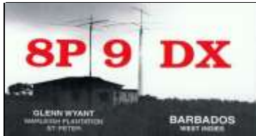
9 - St Peter