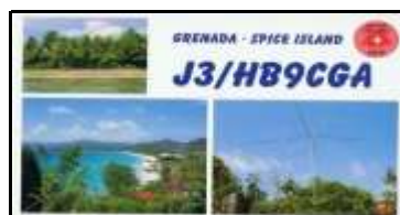
1 - Grenville ( St André ) NA024