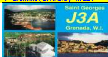
3 - Saint George NA024