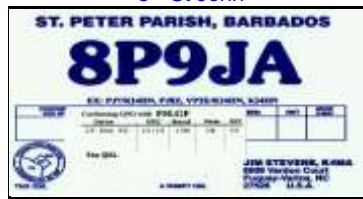
9 - St Peter NA021