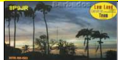
Barbade Island NA021