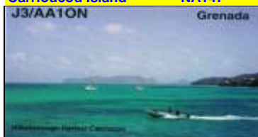
3 - Grand Anse ( St George )