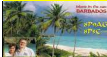
10 - St Philip