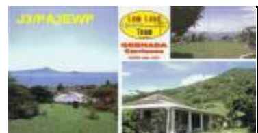
Carriacou Island NA147