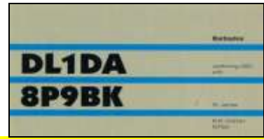
4 - St James