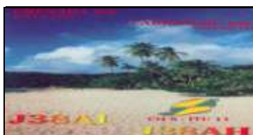
Carriacou Island NA147

Administrativement la Grenade est divisée en 6 sous régions appelées " Paroisses "