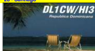
20 - Luperon ( Puerta Lata )