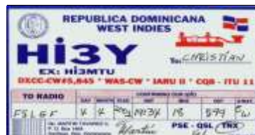
28 - Santiago