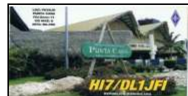
11 - Punta Cana ( La Altigracia )