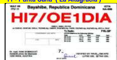
11 - Bayahibe ( La Altigracia )