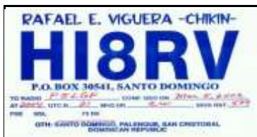
30 - Santo Domingo