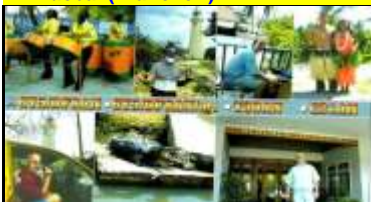
5 - Belmont ( West Morland )