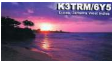
1 - Lucéa ( Hanover )