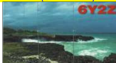
8 - Discovery Bay ' Saint Ann )