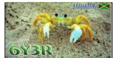
3 - Montego Bay ( Saint James )