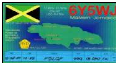
2 - Malvern ( Saint Elizabeth )