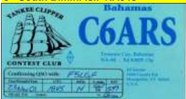
13 - Treasure Cay Isl. NA080