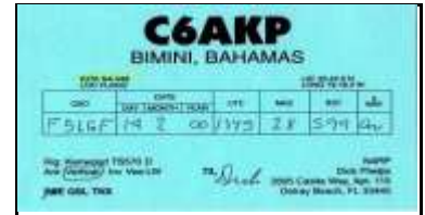
3 - Bimini Island NA048