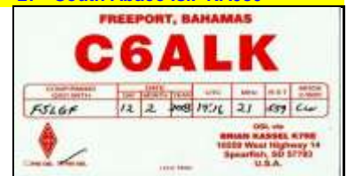
City Of Freeport