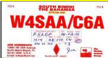
3 - South Bimini Isl. NA048