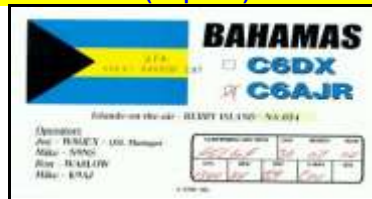
2 - Berry Island NA054