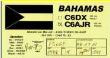
23 - North Eleuthera Isl. NA001