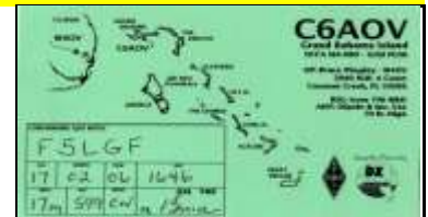
11 - East Grand Bahama NA080