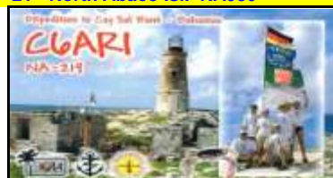
Cay Sal Bank Isl. NA219