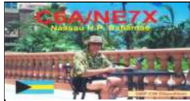
NP - Nassau ( Capitale )