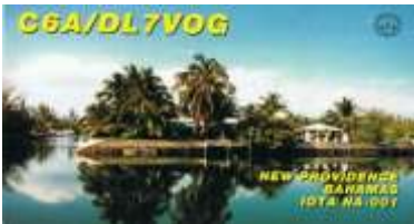
NP - New Providence NA001