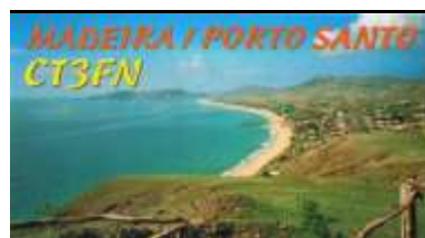
Porto Santo Island