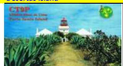
Porto Santo Island