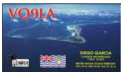
Diego Garcia ( Chagos Isl. ) AF006