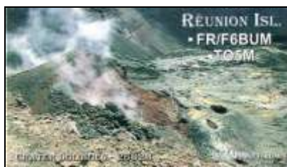
Cratère Dolomieu ( 2632m ) AF016