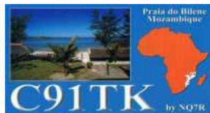
Praia do Bilene