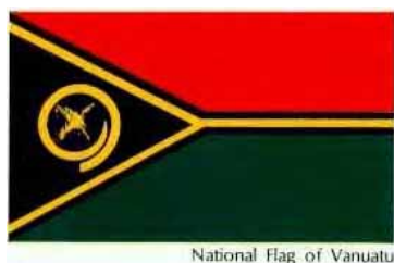
National Flag of Vanuatu

En janvier 1947, René THEVENIN est ré-autorisé, et retrouve son indicatif « FU8AA ». Il le conservera jusqu'en 1972, et sera ensuite « YJ8RT », indicatif attribué par la nouvelle république des VANUATU.