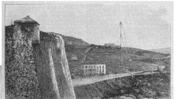
Avril 1901 Fig. 5. -- Vue du mât de Calvi prise des remparts de la ville haute.