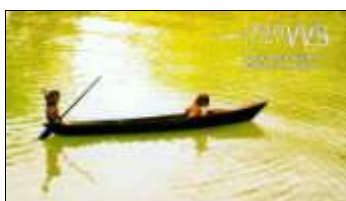
Los Négros Isl.