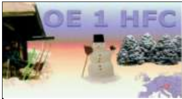
OE1 Wien Stadt