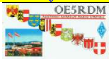
OE5 Ober Osterreich