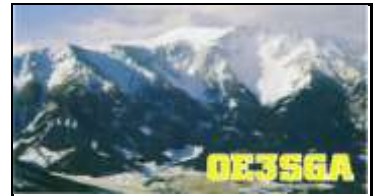
OE3 Nieder Osterreich