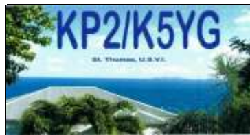
Saint Thomas Isl.