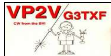
Long Bay Beach