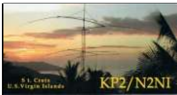
Sainte Croix Isl.