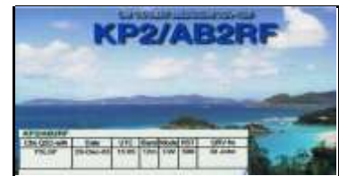
Saint John Isl.