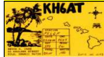
Hilo ( Hawaï ) OC019