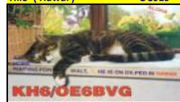
Aloha Isl. OC019