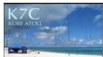
Kure Atoll ( 2005 )