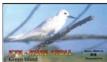
Kure Atoll ( 1997 ) QSL de F5PAC