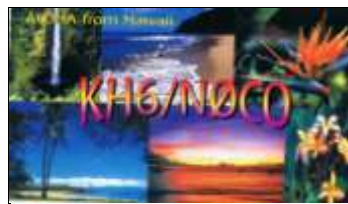
Aloha Isl. OC019