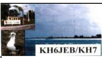
Kure Atoll ( 1992 ) QSL de VK3SX