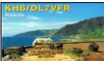
Maui Isl. OC019