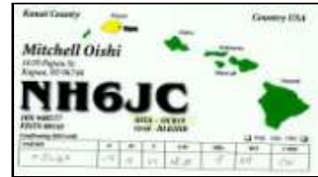
Kauai Isl. OC019