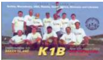
Baker Island ( 2002 ) OC089