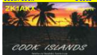
Manihiki Isl. (North Cook) OC014