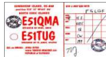
Suvarrow Isl. (North Cook) OC080