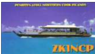
Penrhyn Atoll ( North Cook) OC082