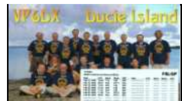
Ducie Isl. ( Feb 2008 ) OC182