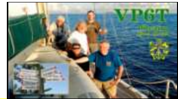
Pitcairn Island (2012) OC044