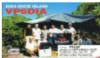
Ducie Isl. ( Mar 2003 ) OC182