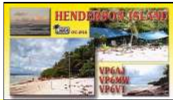
Henderson Isl (2002) OC056