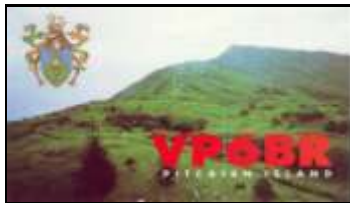
Pitcairn Island (2000) OC044