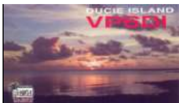
Ducie Island ( Mar 2002 ) OC182