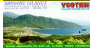
8 - Sulawesi