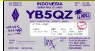
5 - Sumatera