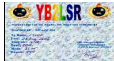
2 - Jawa