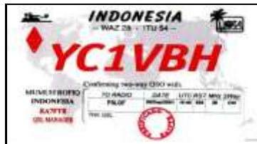
1 - Jawa