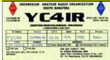
4 - Sumatera