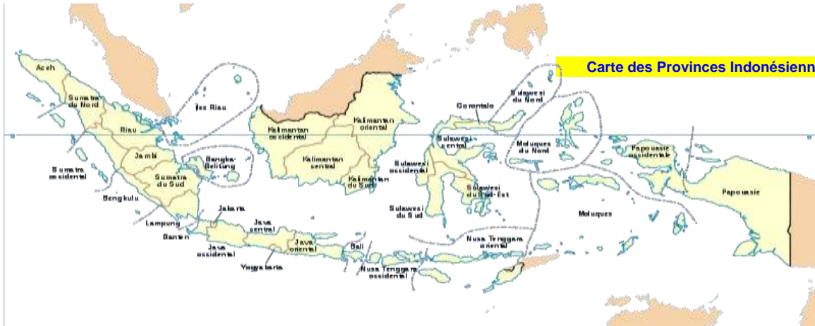
Carte des Provinces Indonésiennes

La République d'Indonésie est une République démocratique dont la Capitale est Jakarta. L'Indonésie est le plus grand Archipel du Monde. L'Indonésie c'est aussi 33 Provinces subdivisées en 398 Départements.