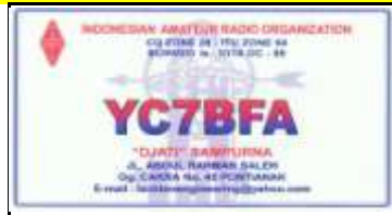
7 - Kalimantan