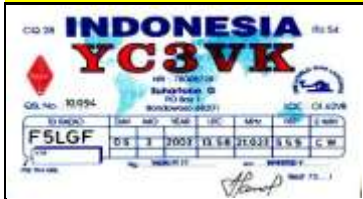
3 - Jawa