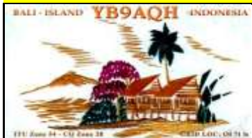
9 - Bali