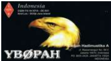
0 - Jakarta