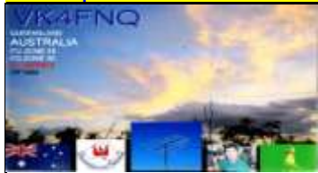
VK4 - Queensland