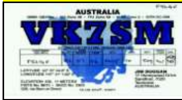
VK7 - Tasmania