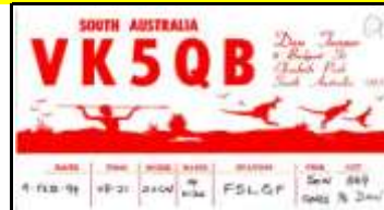
VK5 - South Australia