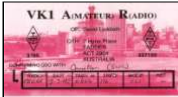
VK1 - Capitale