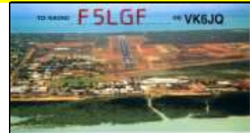
VK6 - Western Australia