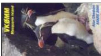
VK0 - Macquarie Isl.

* - Heard et Mac Donald Isl. sont des îles des territoires extérieurs Australien situé dans l'Océan Indien.