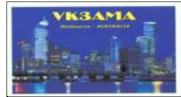
VK3 - Victoria