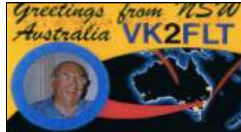
VK2 - New South Wales