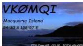
VK0 - Macquarie Isl.