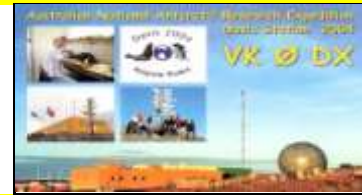
Davis Station " Base Antarctique "