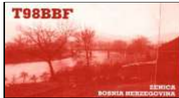
4 - Canton de Zenica-Doboj