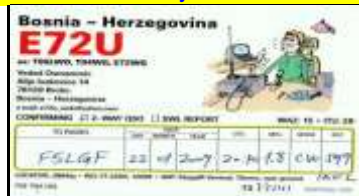
District de Brcko