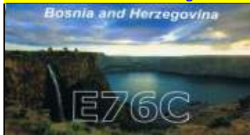
Banja Luka - République SRPSKA