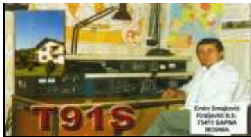
3 - Canton de Tuzla ( Sapna )