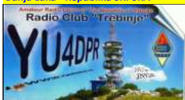
Trébinje - République SRPSKA