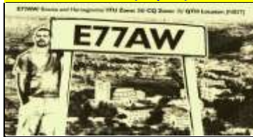
7 - Canton de Neretva Herzég.