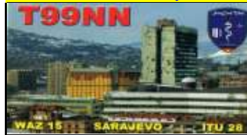
9 - Canton de Sarajevo