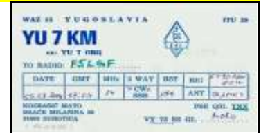
Subotica - Voïvodine