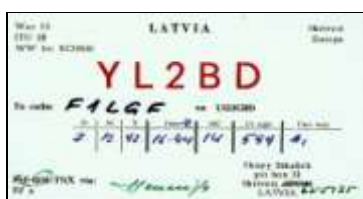
Aizkraukles - YL2BD