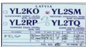
Alūksne - YL2SM