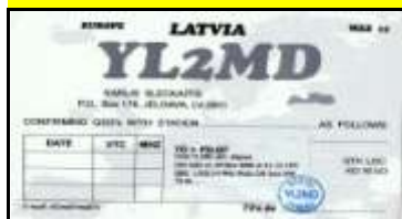
Jelgava - YL2MD