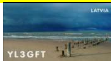
Ogre - YL3GFT