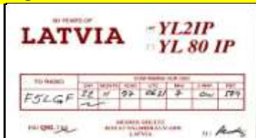
Valmiera - YL2IP