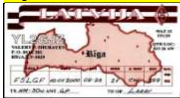
Riga Ville - YL2GJZ