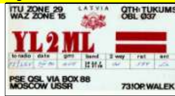
Tukums - YL2ML