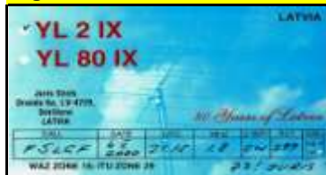
Valkas - YL2IX