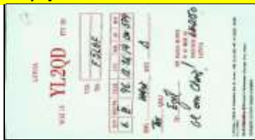
Riga - YL2QD