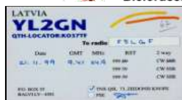
Balvi - YL2GN