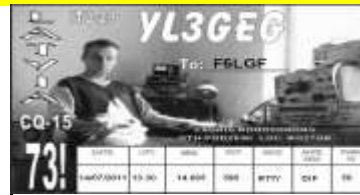
Podzeni - YL3GEG