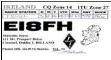
* 1 - Dublin