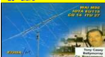
* 23 - Roscommon