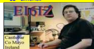
* 22 - Mayo