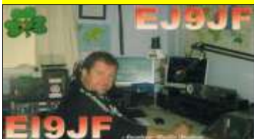
* 5 - Kildare