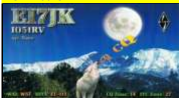
* 16 - Cork