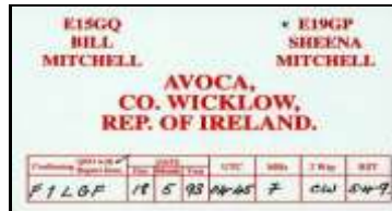
* 2 - Wicklow