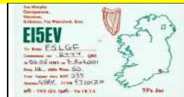
* 15 - Waterford