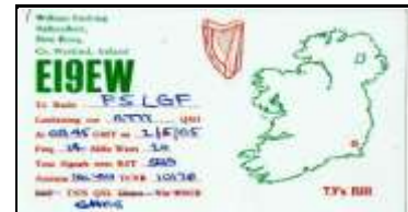
* 3 - Wexford