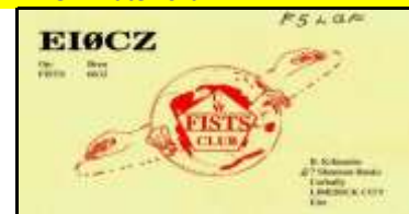
* 18 - Limerick