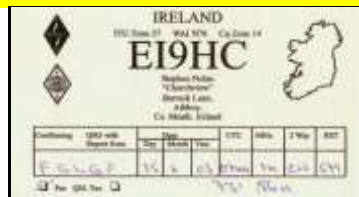
* 6 - Meath