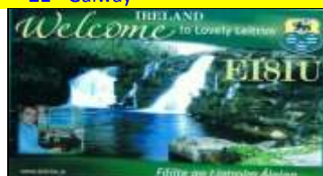
* 25 - Leitrim