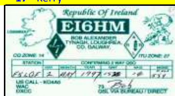
* 21 - Galway