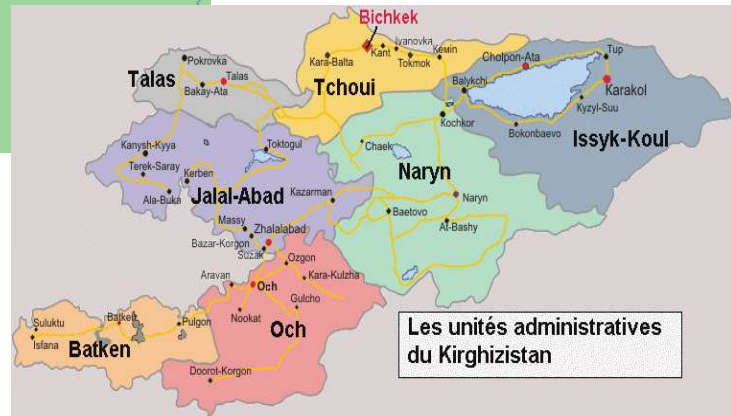
Les unités administratives du Kirgizstan