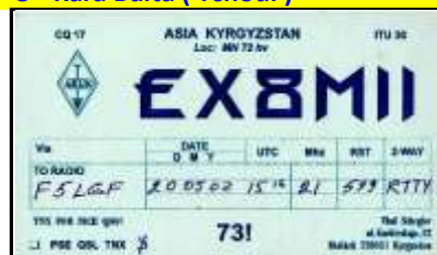
QSO en RTTY