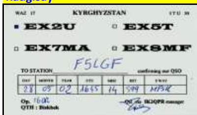
QSO en MFSK