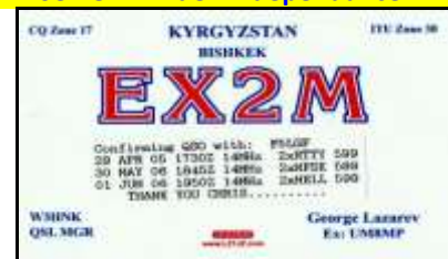
QSO en MFSK et Hellschreiber