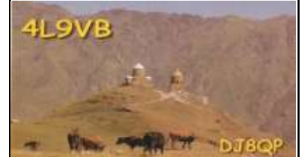
9 - Kazbegi ( Mtskheta-Mtianeti )