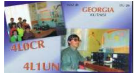
6 - Kutaisi ( Iméréthie )