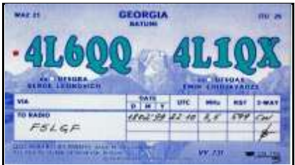
4 - Batumi ( Rép. Auto. d'Adjarie )