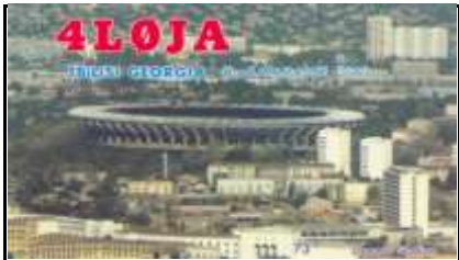
12 - Tbilissi