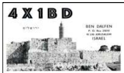
5 - Jérusalem ( District de Jérusalem )