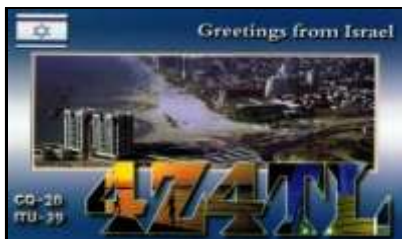
4 - Tel Aviv ( District de Tel-Aviv )