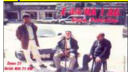
Bande de Gaza