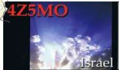
1 - Karmiel ( District du Nord )