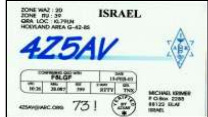
6 - Eilat ( District du Sud )