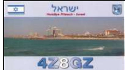
3 - Herzliya ( District Centre )