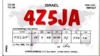
2 - Haifa ( District de Haifa )