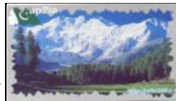
Lahore ( Le Penjab )