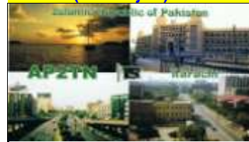
Karachi ( Balouchistan )