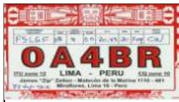
4 - Lima ( Capitale )