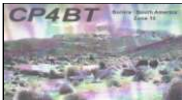
4 - Tomave ( Potosi )

Nota : L'identification des stations CP en fonction de leur département se fait par le chiffre contenu dans le préfixe de l'indicatif.