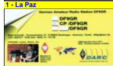
6 - Camiri ( Santa Cruz )