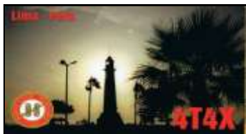
4 - Lima