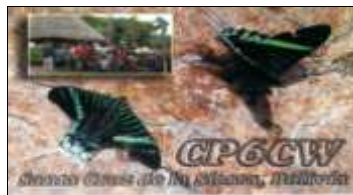
6 - Santa Cruz de la Sierra