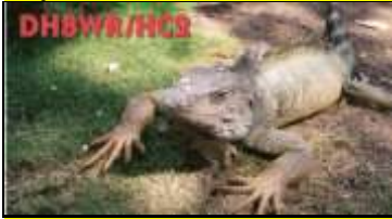
Guayas ( Salinas )