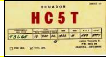
Azuay ( Cuenca )