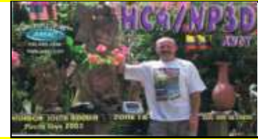
Manabi ( Puerto Cayo )