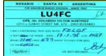
F - Santa Fé