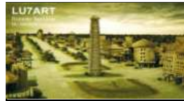
A - Capitale Fédérale