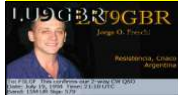
G - Chaco