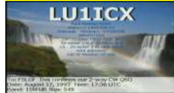
I - Misiones