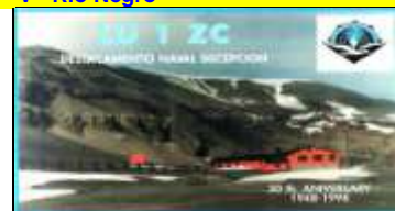
Z - Base Antarctique Argentine