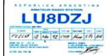
D - Buenos Aires