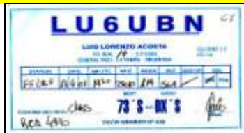
U - La Pampa