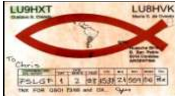
H - Cordoba