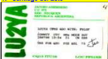
Y - Neuquen