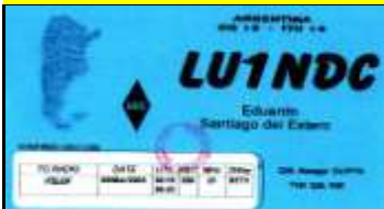
N - Santiago del Este