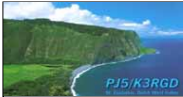
St Eustatius NA145