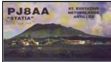
St Eustatius NA145