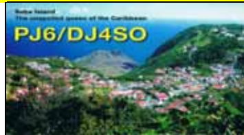
Saba Isl. NA145