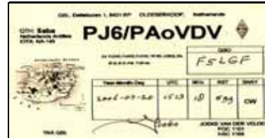
Saba Isl. NA145