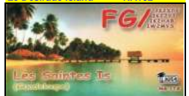
Les Saintes Island NA114