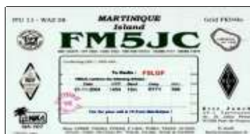
Fort de France