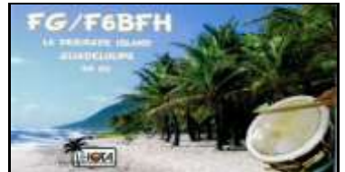
Le Désirade Island NA102