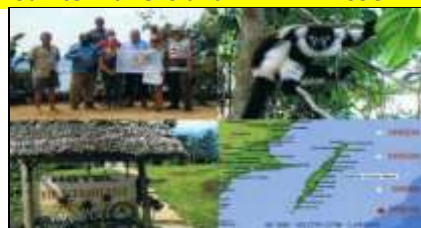
Sainte Marie Island AF090