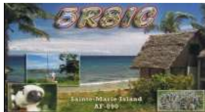
Sainte Marie Island AF090