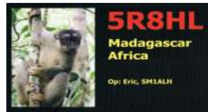
Nosy Be AF057