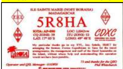
Nosy Boraha AF090