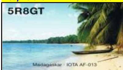
Madagascar IOTA AF-013