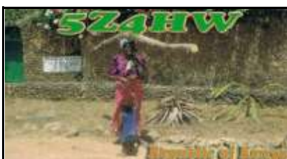
Diana Beach ( Nr Mombasa )