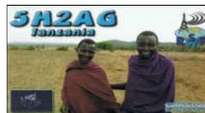
1 - Arusha