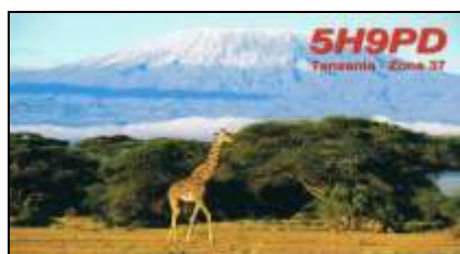
14 - Mt Wanza