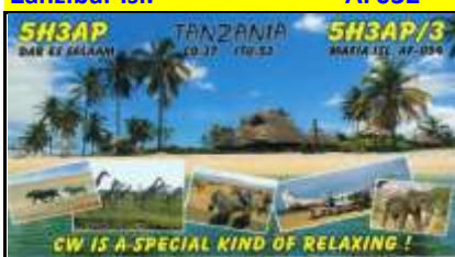
2 - Dar es Salam