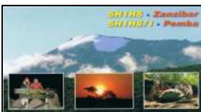
Zanzibar Isl. AF032