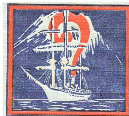
Mission du Cdt. CHARCOT navire le "Pourquoi-Pas" en 1930...