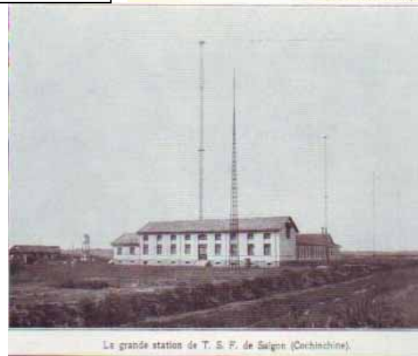
La grande station de T. S. F. de Saigon (Cochinchine).