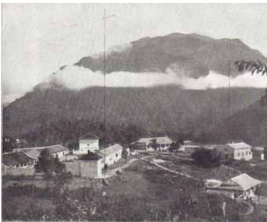
La station de T. S. F. de Hanoi (Indochine), à Lachau (Tonkin), près du poste de la garde indienne et des télégraphes.