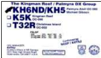
Palmyra Atoll ( 2000 ) OC 085