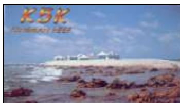
Kingman Reef ( 2000 ) OC096