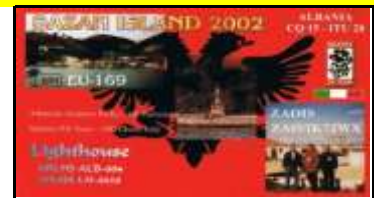
ZA0 - Sazan Isl. IOTA EU169