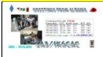
ZA3 - Gjirokaster (Golem)