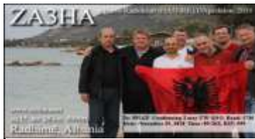
ZA3 - Vlorë (Radhimë)