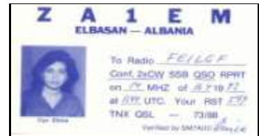
ZA1 - Elbasan