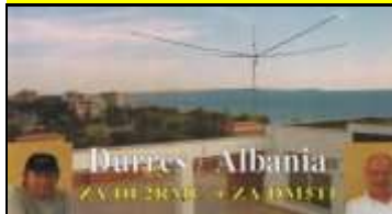
ZA1 - Durrës