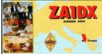
ZA1 - Tirana