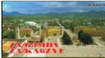
ZA1 - Tirana